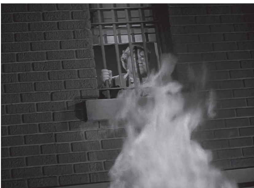
Photogrammes tirés de films de Fritz Lang. Dans l'ordre : M Le maudit (1931), L'In vraisemblable vérité (1956), Furie (1936)